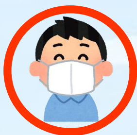
前橋市のマスコット 「ころとん」